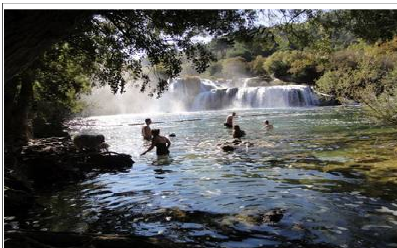
Og så er det "badetid"!