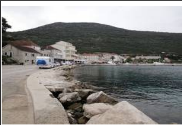
Færgenhavnen i Trpanj.