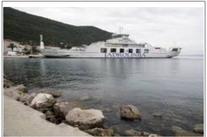
"Færgen er i havn om få minutter"!