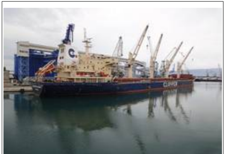
Ploče havn anløbes af andet end færger.

På fastlandet får vi et par hundrede kilometer motorvejskørsel. Hvilket Fiatén er ganske godt tilfreds med! Vi tager frakørslen mod Šibenik , og kører til en lille campingplads nær Kraka Nationalpark .