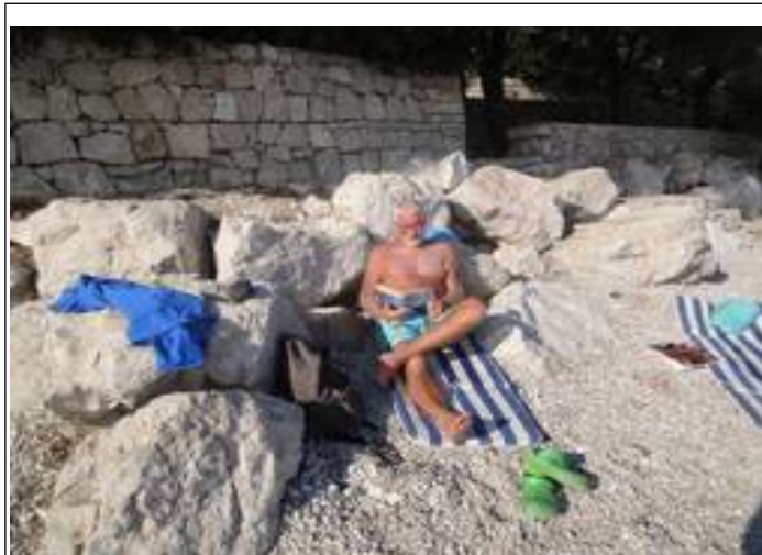
Nej! Det her er ikke ”Bonderøven”!