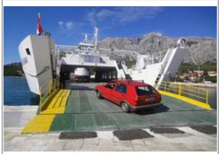
Bilfærgen til Korčula.

Mandag den 10. oktober. Vi opdagede dog, at passagerfærgen til Korčula kun sejlede jævnligt på hverdage, og bilfærgen lagde til noget uden for Korčula by. Så vores lille "ø-hop" blev udsat til i dag. Overfartstid 15 min. og der var pænt mange passagerer med den lille motorbåd.