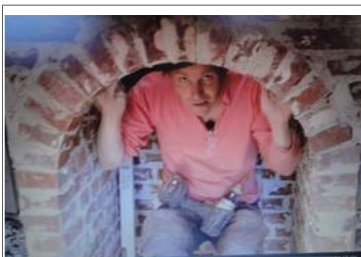
Den ægte vare.

Lørdag den 8. oktober. Vi ligger lidt uden for byen, så cyklerne kommer ned af stativet, når vi triller ind til den lille havn med færgeforbindelse til den nærliggende ø, Korčula .