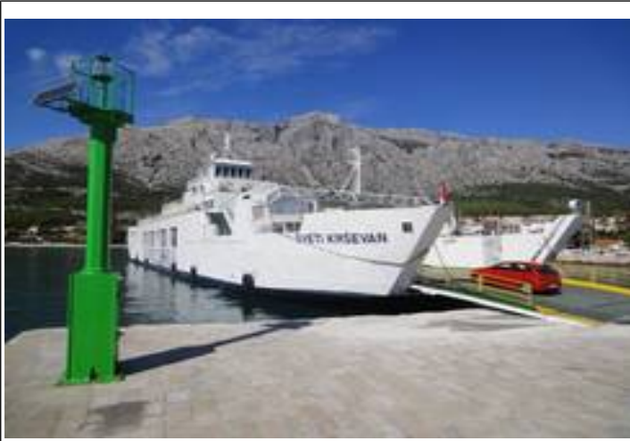
Bilfærgen til Korčula.