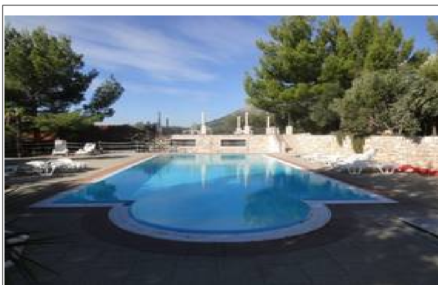
Camping Nivio, Orebić.

Og kommer der en byge, er der tålelig netforbindelse, så indendørs kan vi hygge os med f.eks. ”Bonderøven”!