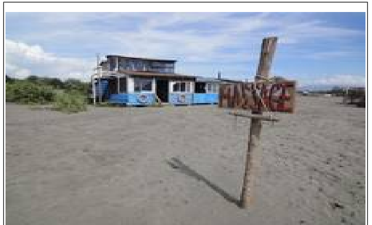
Man er nu også leveringsdygtig i andre ydelser!