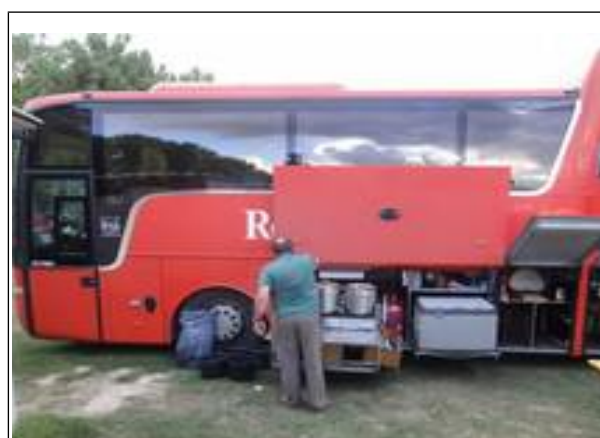
Så er der snart serveret!

Har man en rigtig stor familie, er her måske et godt bud på en sommerferietur. Her er plads til 24 sovende beboere, og chaufføren klarer alle opgaver fra madlavning til toilettømning!