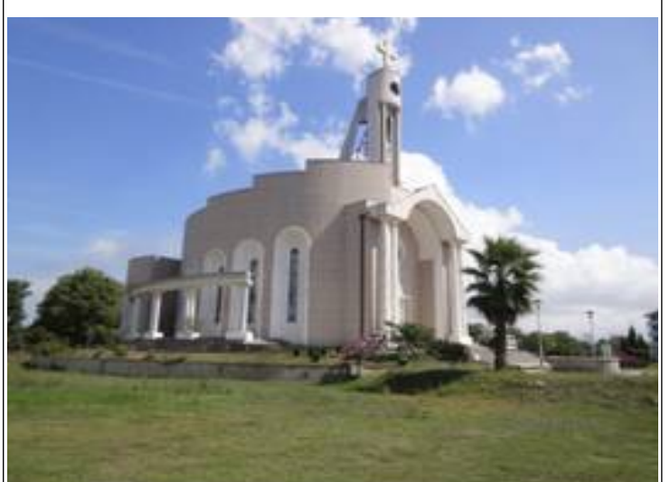
Katolikkerne har godt fodfæste i Montenegro.

Byen ligger ved udløbet af en flodarm til grænsefloden, og er meget besøgt af lokalbefolkningen. Vi nød en eftermiddag sammen med de lokale lystfiskere og badedyr.