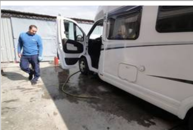
På værksted igen.