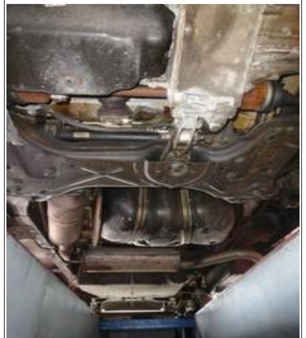
På bunden er den egentlig god nok!

Ud med det gamle og ind med noget nyt. Og så prøver vi at regenerere partikelfiltret igen. Det foregår under meget høje temperaturer, så der er både kølevand og pulverslukker ved hånden. Men det hjalp nu lige fedt. Efter fire timer lykkedes