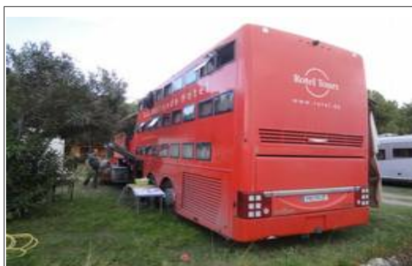
Alternativ til et bofællesskab på ferie!

Har man en rigtig stor familie, er her måske et godt bud på en sommerferietur. Her er plads til 24 sovende beboere, og chaufføren klarer alle opgaver fra madlavning til toilettømning!