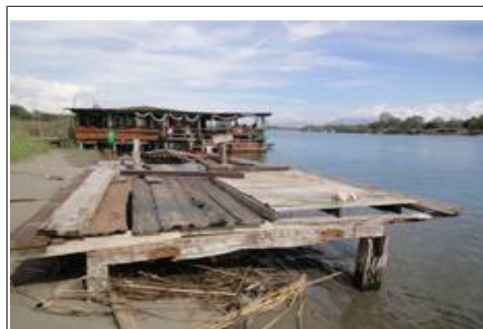
Ada Bojana. Og sulten stilles uden problemer.

Men endelig, efter 15 dage, får vi besked om, at reservedelen er ankommet til værkstedet efter en tur forbi Montenegros toldvæsen, hvor told, bureaukrati, papir m.v. løber op i 100,00 €. Så er det vist også betalt.