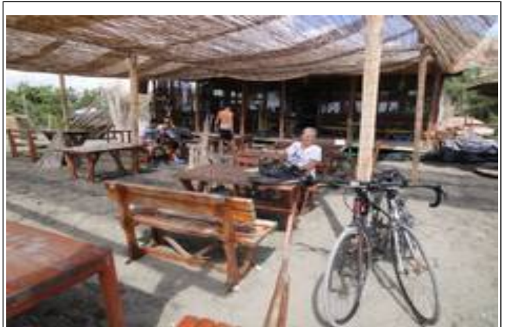
En kølig pilsner fra kassen!

Men endelig, efter 15 dage, får vi besked om, at reservedelen er ankommet til værkstedet efter en tur forbi Montenegros toldvæsen, hvor told, bureaukrati, papir m.v. løber op i 100,00 €. Så er det vist også betalt.