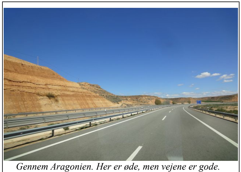
Gennem Aragonien. Her er øde, men vejene er gode.