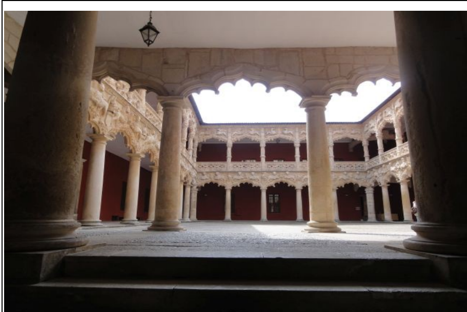
Guadalajara. Palacio de los Duques del Infantado.