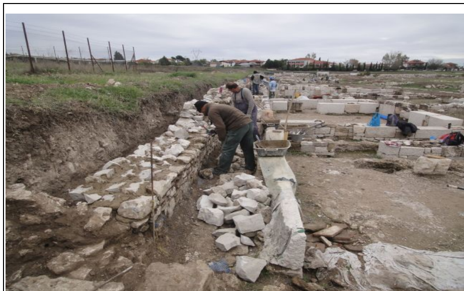
Det Antikke Pella.