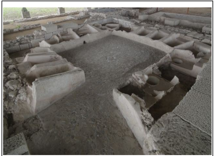
Og fællesskab på lokum!

Tirsdag den 28. oktober er festen slut i Grækenland. Der venter kun den lidt trælse hjemtur på ca. 2.500 km. Dem kunne vi nu godt undvære!