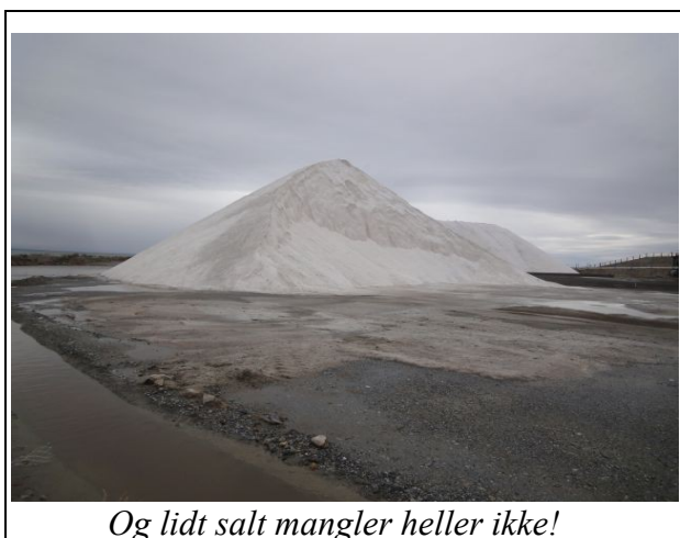
Og lidt salt mangler heller ikke!

Vejret har taget en voldsom kovending. Vi må nu finde os i kulde, regn og blæst, så havbadene har vi indstillet indtil videre, selv om der er bruser på stranden. Men ture langs