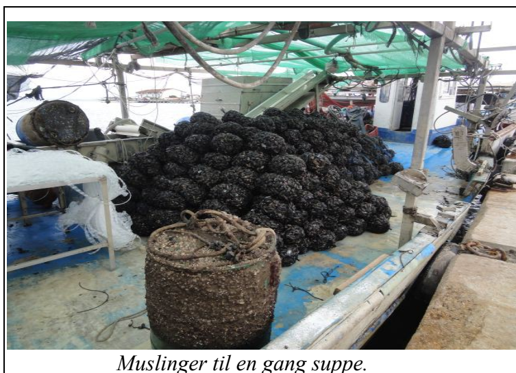
Muslinger til en gang suppe.