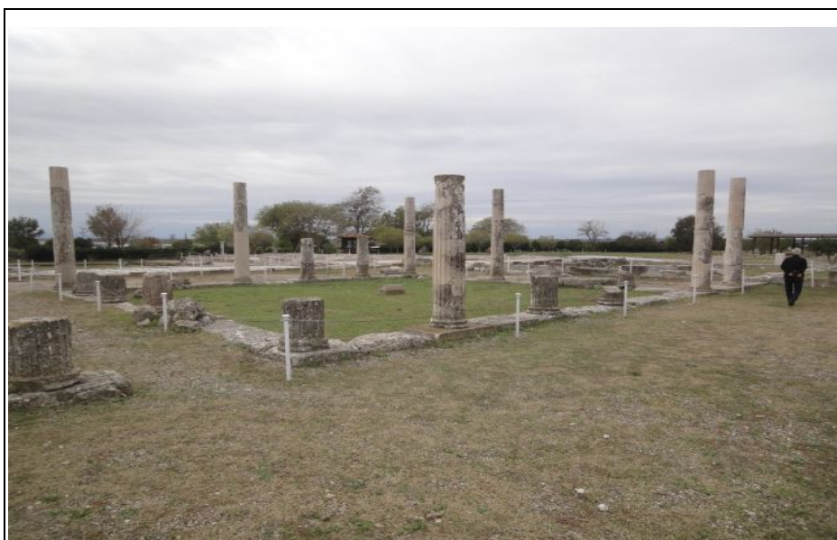
Det Antikke Pella.

Det giver os så den fordel, at alle, såvel arbejdere som arkæologer, forfærdelig gerne vil delagtiggøre os i deres viden om byen og det arbejde de udfører. Så det der i første omgang blot var væltede sten, blev pludselig interessant underholdning.