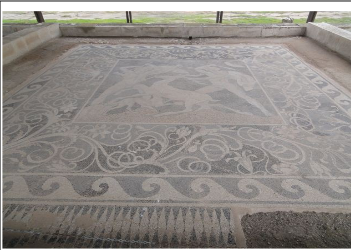
Antikke Pella. Kunst på gulvet.